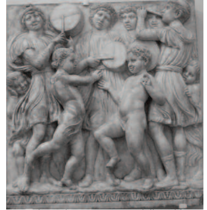
Detail van de Cantoria Luca della Robbia (15e eeuw, Florence)

SALAMONE ROSSI HEBREO Psalm 128: 'Shir hamma'alót'. 'Ashrei kol yere 'adonai'