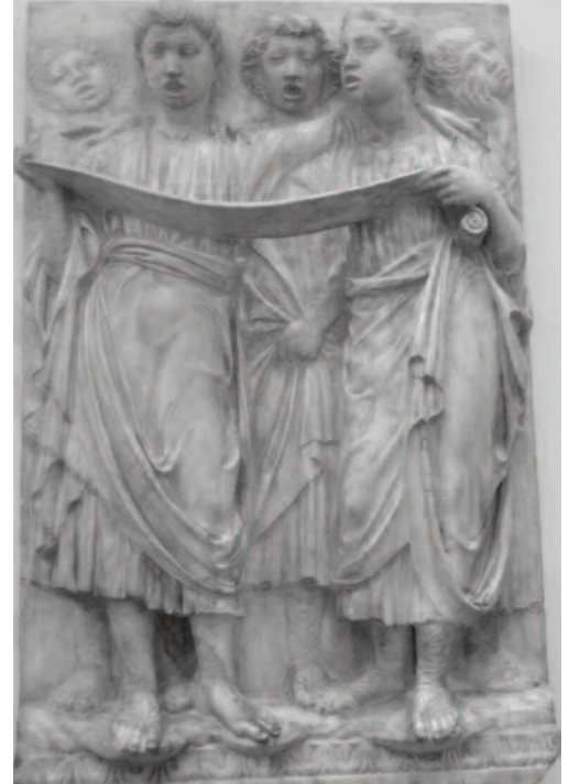
Detail van de Cantoria Luca della Robbia (15e eeuw, Florence)