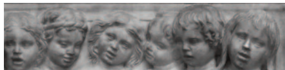
Detail van de Cantoria Luca della Robbia (15e eeuw, Florence)