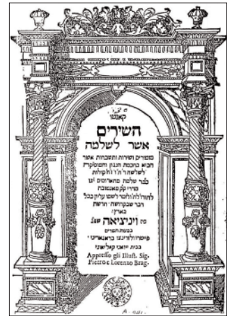
Uit het boek: Hashirim asher leSholomo – Het lied van Salomo, Rossi (± 1622)

De joodse componist Salomone Rossi (ca. 1570-1630) werkte aan het hof van de kunstminnende Gonzaga, hertog van Mantua. Net als in andere gebieden in Italië, dwong rond 1612 ook Gonzaga de joden in een getto te leven. Zijn waardering voor het veelzijdige werk van Rossi was echter zo groot, dat deze van het dragen van de jodenster werd uitgezonderd.