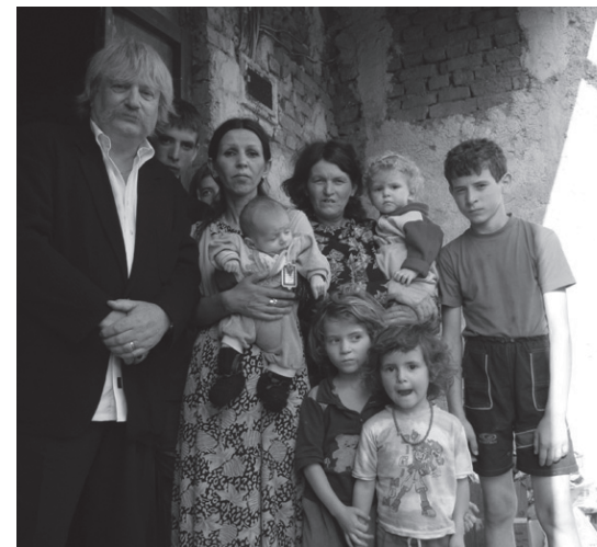
Karl Jenkins in Kosovo

De opbouw van The Armed Man leidt ons door alle stadia van oorlog. In de muziek komt dit tot uiting in dreiging, agressie, ontzetting en verdriet om uiteindelijk uit te komen bij hoop en vrede.