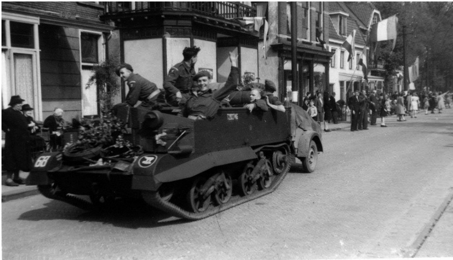
Bevrijding Driebergen, 7 mei 1945